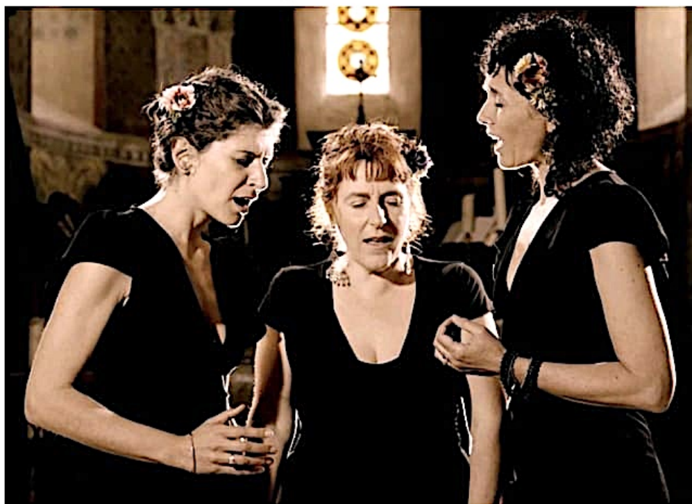
Le trio polyphonique La Soubirane sera à l'abbaye le 4 janvier.

Tarifs : plein 20 €, réduit 10 €, adhérents 15 €. Réservations en ligne : https://www.helloasso.com/.../l-etoile-de-la-peace-chants... Ou achat des billets sur place le jour du concert. Billetterie ouverte une heure avant le début du concert. Adresse : abbaye Saint-Martin, place du Révérend-Père-Lambert à Ligugé.