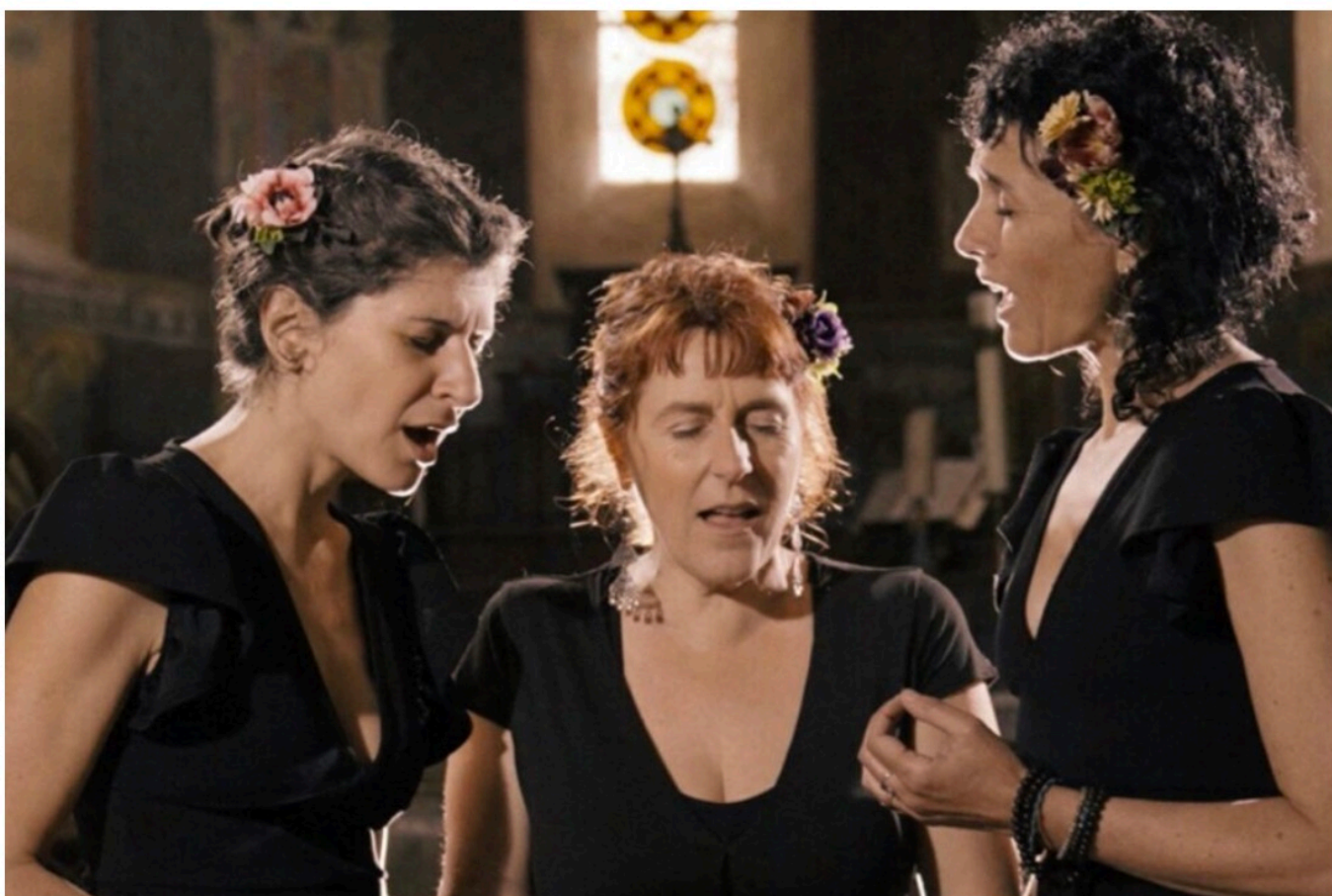
La Soubirane en concert dans trois villages du Lot les 23, 24 et 25 mai 2025.

Entre humour, découverte de la nature, musique classique, comme jazz, voici les coups de cœur de notre rédaction pour sortir dans le Lot ce week-end des 23, 24 et 25 mai.