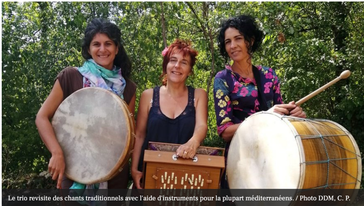
Le trio revisite des chants traditionnels avec l'aide d'instruments pour la plupart méditerranéens.