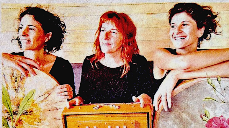
Polyphonie, percussions... pour un trio qui défend en musique les valeurs féminines.

En livrant ces chants et leurs histoires, avec une proximité simple et joyeuse avec le public, les chanteuses promettent "une harmonie mystique". Le programme présentera des chants de la grande Occitanie (béarnais, provençaux, niçois et du nord du Pays basque), ainsi que des chants méditerranéens (Grèce, Espagne, Italie,