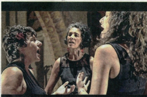
« La Soubirane ». © Marc A. Deckers.

Depuis sa plus tendre enfance Carine Joanny est animée par une aspiration pour le sacré. Elle a toujours portée en elle cet impalpable feeling. Une forme d'apaisement que lui procuraient le cérémonial et les chants de messes du dimanche, les paroles du prêtre et le recueillement inspiré par les églises. Sans même y penser, cette expérience lui a inspiré une fascination pour